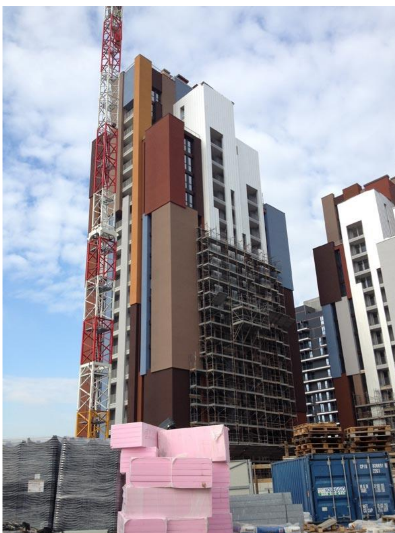
Il cantiere degli edifici presso Cascina Merlata